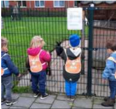
Een beetje kou en nevelregen houdt ons niet tegen! Gezellig zingend, hand in hand naar de kinderboerderij en speeltuin!